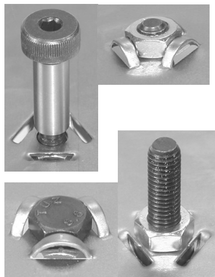
Obr. 3: Tvar vyrobený nástrojem HexLock™ uchytlí šroub DIN933, který vyčnívá skrz plech. Následně je namontována matice.